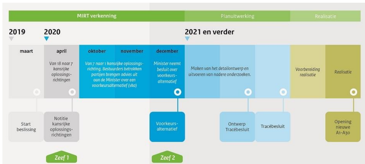
Figuur: schematisch overzicht van vervolgstappen naar Voorkeursalternatief

Na een periode van onderzoek, werken we toe naar het vaststellen van een Voorkeursalternatief.